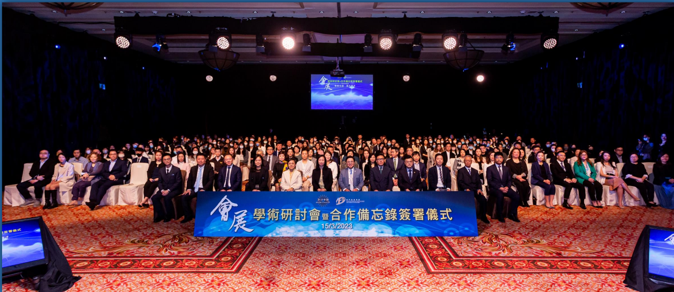
金沙中國 與 澳門旅遊學院 合辦的「會展學術研討會」 共吸引了超過 210 名澳門大專院校學生、會展業界人士及金沙中國員工參與