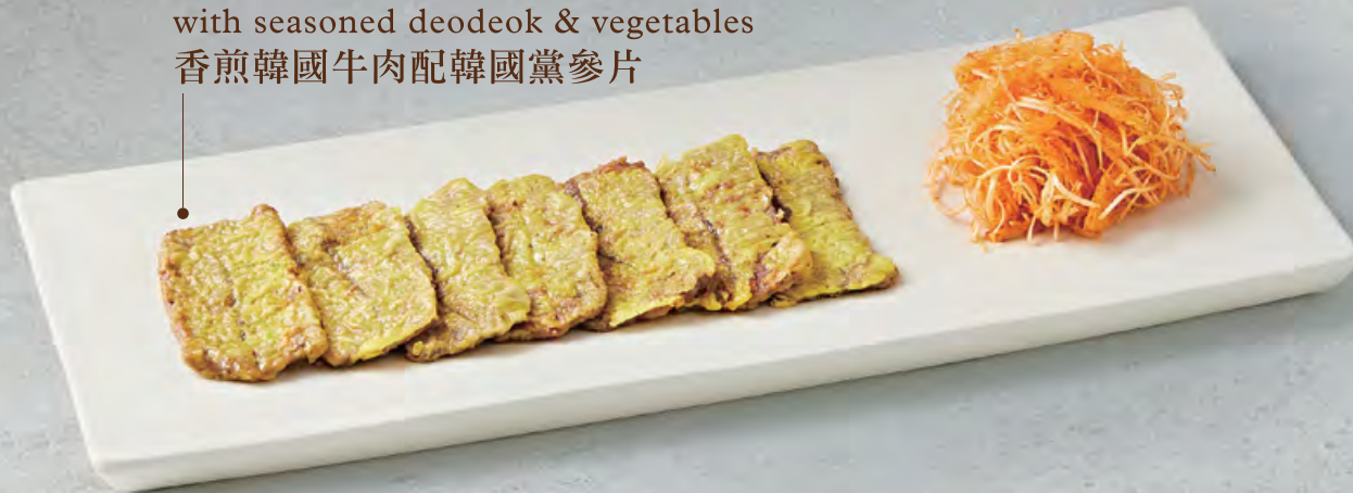
④ 한우육전과 더덕초무침 $ 358 🍳 Pan-fried Korean beef with seasoned deodeok & vegetables 香煎韓國牛肉配韓國黨參片