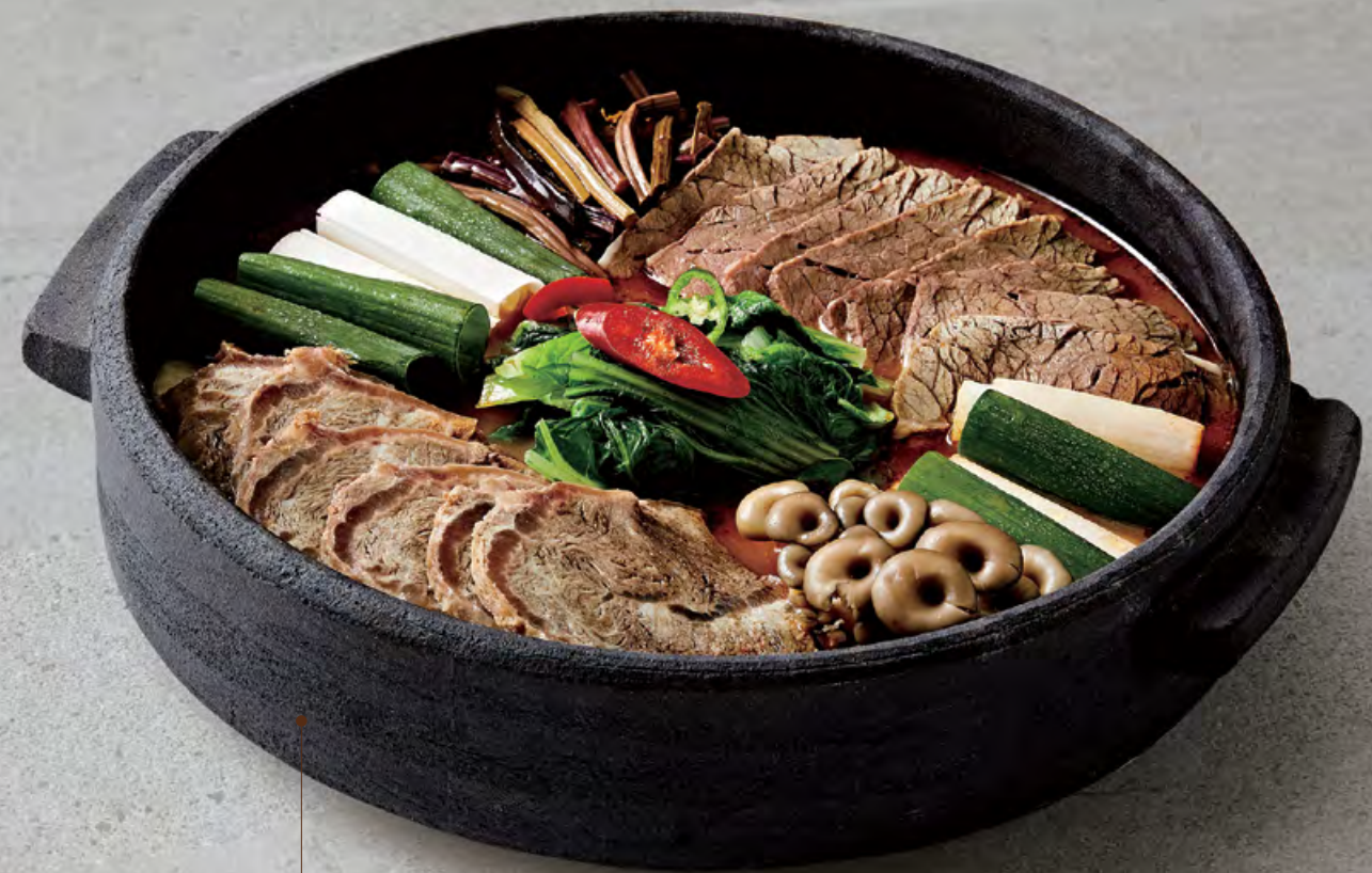
⑲ 육개장 전골 $ 398 / Spicy hot pot with beef brisket and various vegetables 辣牛腩野菜火鍋

별도 부가세 10%가 추가됩니다 | SUBJECT TO 10% SERVICE CHARGE | 另加一服務費 실물은 사진과 다를 수 있다는 점 양해 바랍니다 | IMAGES FOR REFERENCE ONLY | 圖片只供參考