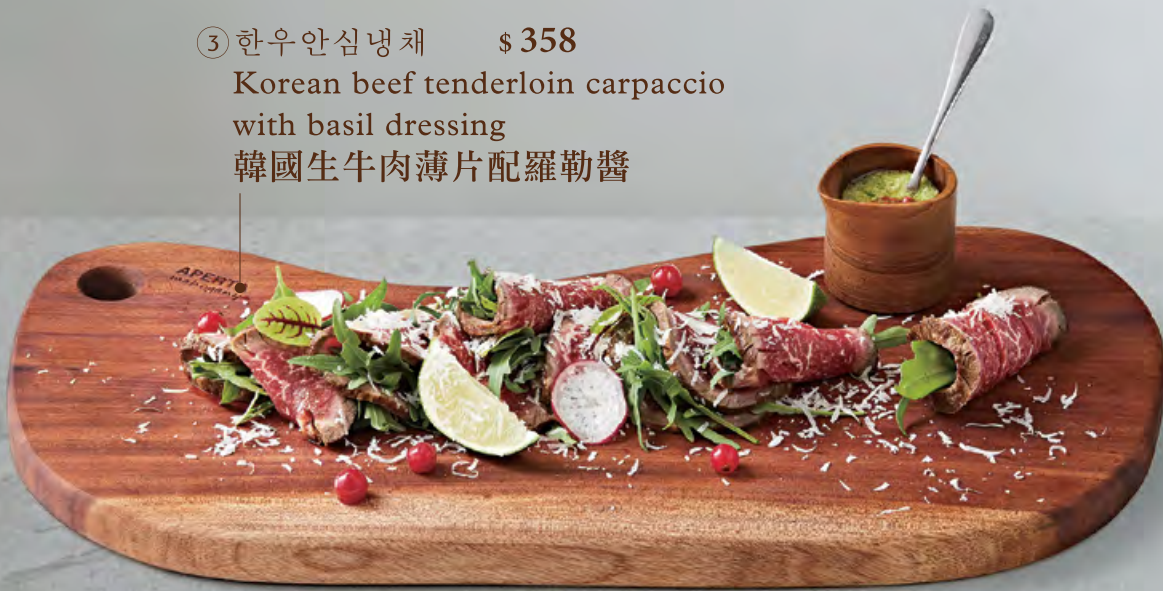
③ 한우안심냉채 $ 358 Korean beef tenderloin carpaccio with basil dressing 韓國生牛肉薄片配羅勒醬