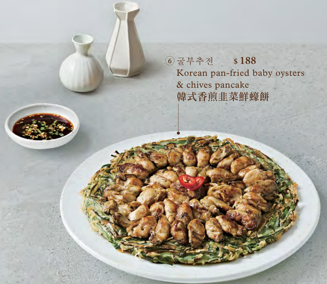
⑥ 굴부추전 $ 188 Korean pan-fried baby oysters & chives pancake 韓式香煎韭菜鮮蠔餅