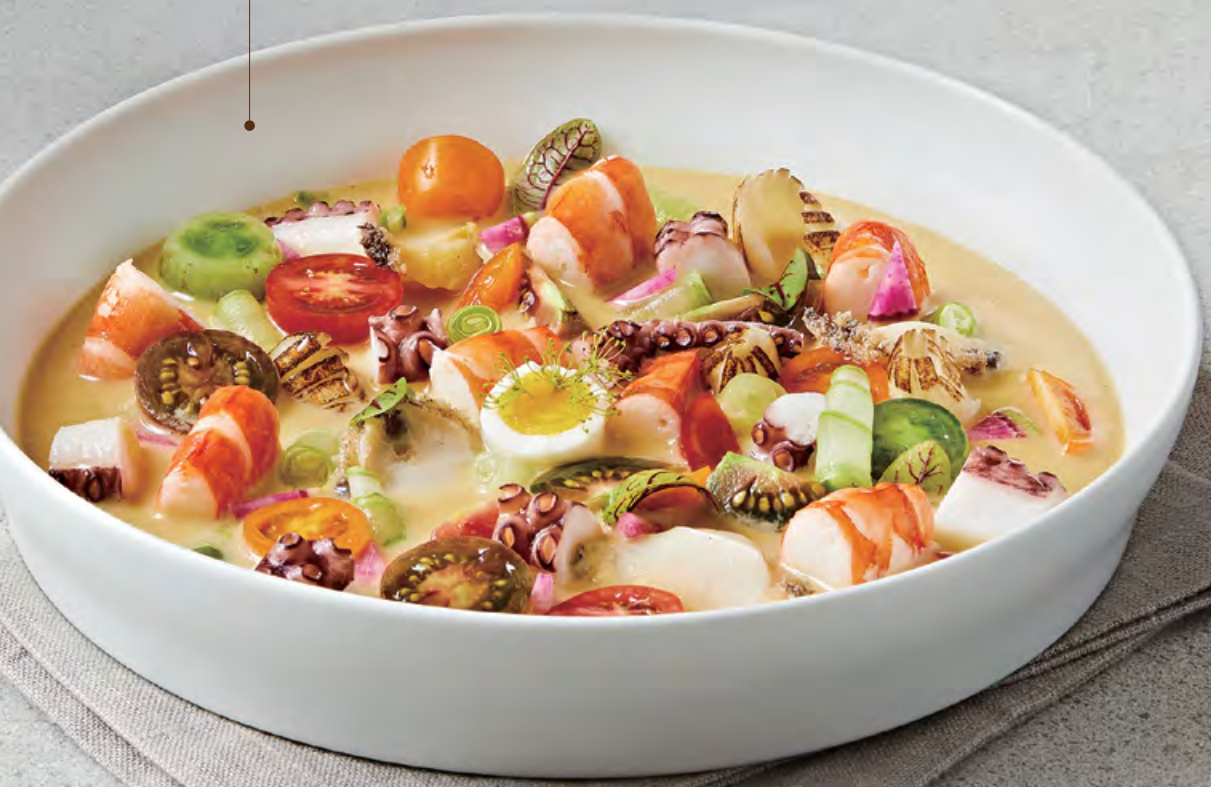
① 잣겨자 해물냉채 $ 248 🍳 Seafood salad with pine nut mustard dressing 海鮮沙律配松子仁香芥末醬