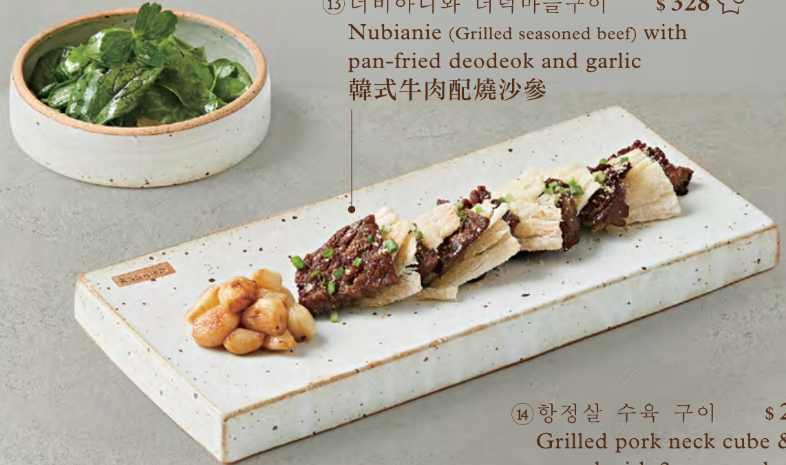
⑬ 너비아니와 더덕마늘구이 $ 328 🍳 Nubianie (Grilled seasoned beef) with pan-fried deodeok and garlic 韓式牛肉配燒沙參