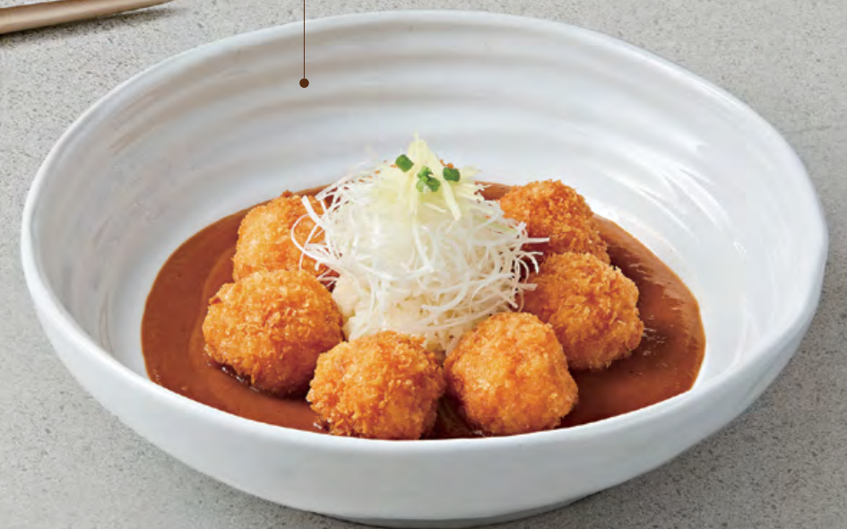
⑨ 새우완자와 비스큐소스 $228 🍳 Fried shrimp meatballs & garlic butter rice with rich bisque sauce 脆炸蝦肉丸子和濃湯醬