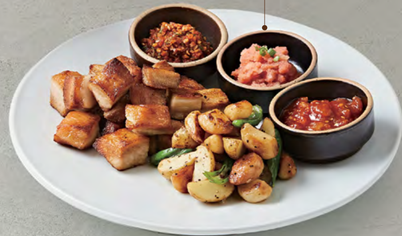
⑭ 항정살 수육 구이 $ 248 🍳 Grilled pork neck cube & vegetables served with 3 seasoned side dishes 醬燒豬頸肉粒及野菜配韓式三小碟