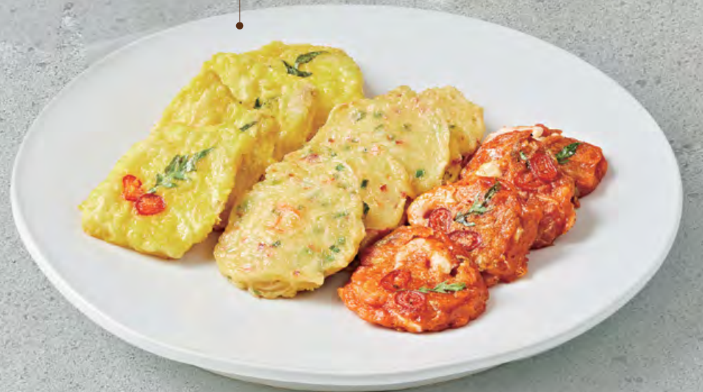
⑦ 모듬전 (12pcs) $ 228 🍳 Assorted savory pancakes (12pcs) 香煎韓式雜錦脆餅 (12塊)