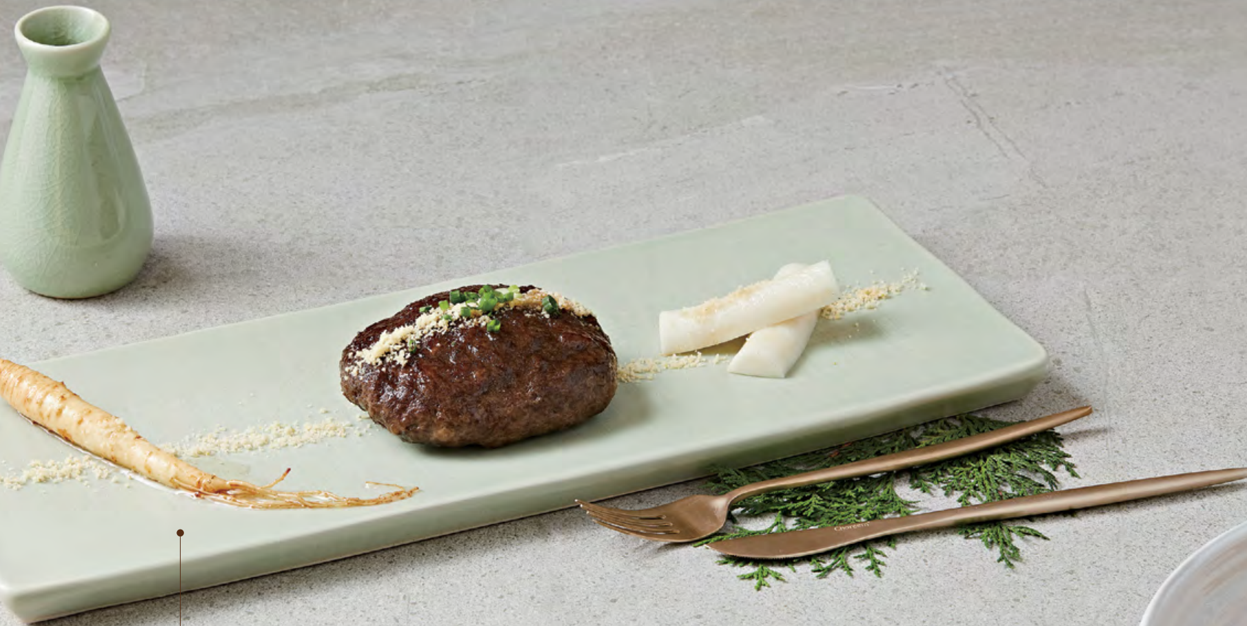
⑧ 비스트로서울 떡갈비 $448 🍳 Homemade Korean beef patties grilled with honey soy sauce served with rice cakes and honey glazed ginseng 烤手工製牛肉餅伴年糕配蜜糖醬油汁