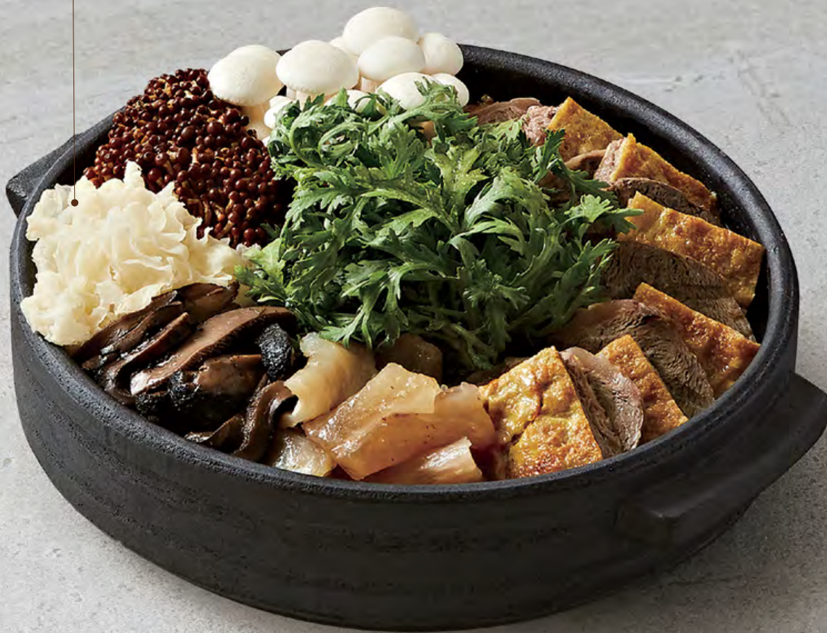
⑱ 능이버섯 수육전골 $ 498 Wild mushrooms & braised beef hot pot 牛肉野菌火鍋