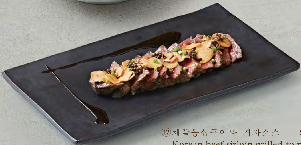
⑫ 채끝등심구이와 겨자소스 $ 448 🍳 Korean beef sirloin grilled to perfection served with crispy garlic & mustard sauce 烤半熟極品1++韓國西冷扒伴脆蒜片及芥末醬