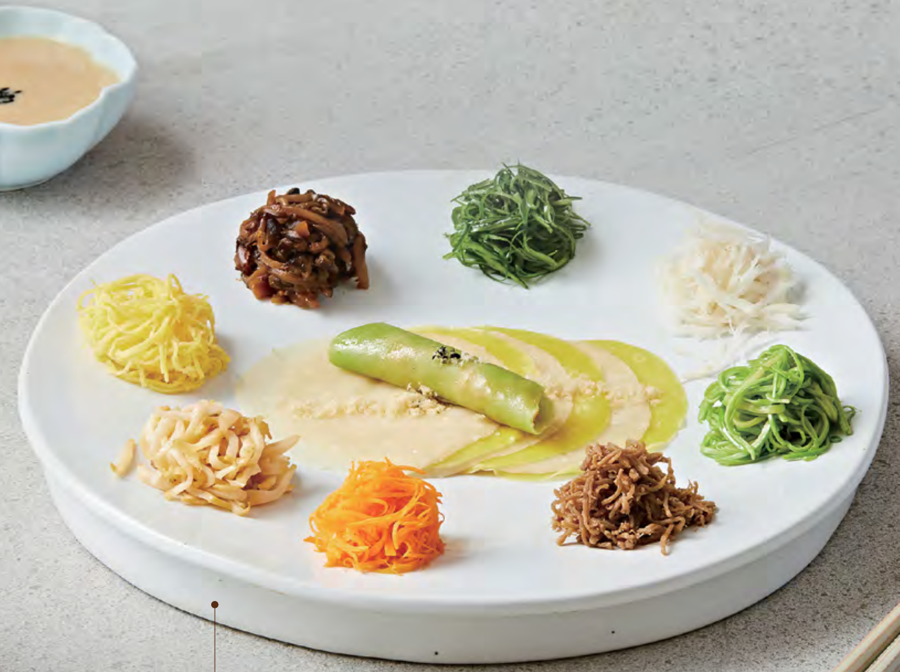
② 구절판 $ 198 🍳 Seoul platter of 9 delicacies 首爾九色拼盤

별도 부가세 10%가 추가됩니다 | SUBJECT TO 10% SERVICE CHARGE | 另加一服務費 실물은 사진과 다를 수 있다는 점 양해 바랍니다 | IMAGES FOR REFERENCE ONLY | 圖片只供參考