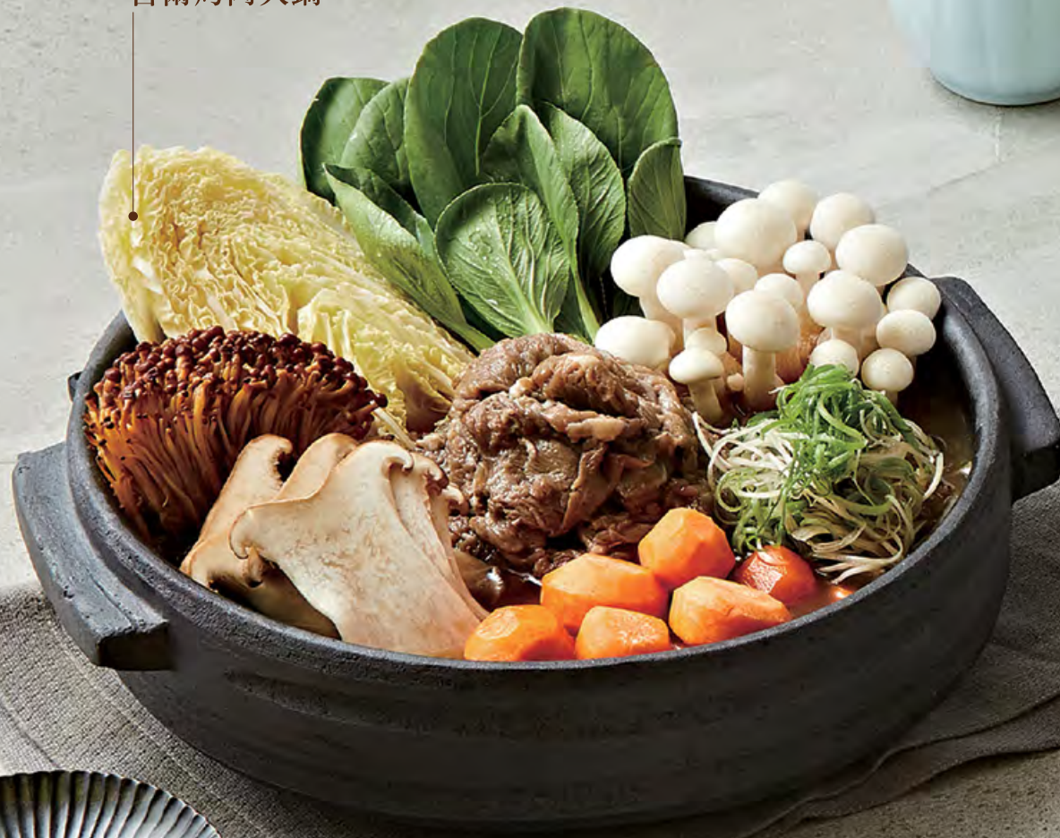
①6 서울 불고기전골 $ 428 Seoul style bulgogi hot pot 首爾烤肉火鍋