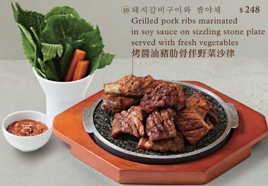
⑩ 돼지갈비구이와 쌈야채 $ 248 Grilled pork ribs marinated in soy sauce on sizzling stone plate served with fresh vegetables 烤醬油豬肋骨伴野菜沙律